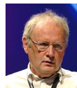
Marc Giget Président de l'European Institute for Creative Strategies and Innovation

Vous pouvez également poser des questions au préalable par SMS au 06 07 96 38 63 auxquelles il sera répondu lors du direct.