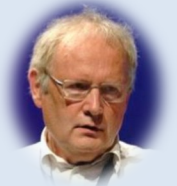
Marc Giget, Président de l'Institut Européen de Stratégies Créatives et d'Innovation

*La 1 ère est visible sur cette chaîne : https://www.youtube.com/watch?v=TSS2HJe_qc0