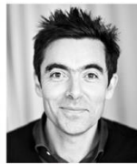
Patrick JOUIN Agence Patrick JOUIN