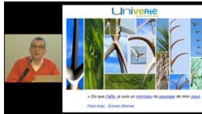
Art et progrès humain La Place de l'individu Frédéric Simon - Nimos Design

https://vimeo.com/channels/mardisinno/388709291