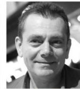
Frédéric SIMON NIMOS Design