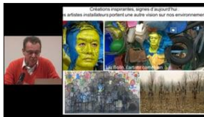
Art et progrès humain Frédéric Simon Nimos Design

https://vimeo.com/channels/mardisinno/387000362