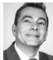
Frédéric SIMON NIMOS Design