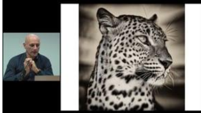
Art et progrès humain Pascal Raso Photographe

https://vimeo.com/channels/mardisinno/386995424