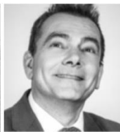
Frédéric SIMON NIMOS Design