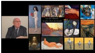
Technologie, IA et place de l'individu dans la création artistique - Marc Giget

https://vimeo.com/channels/mardisinno/388709436